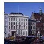
Dat Hoghehus, Koberg