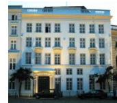
Dat Hoghehus, Koberg